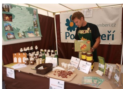
Farmářské trhy v Českém Brodě