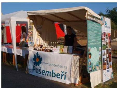
Slavnost na středov. tvrzi ve Vyšehořovicích

V průběhu prázdnin i podzimu se účastníme nejrůznějších akcí v regionu. Namátkou např. 680 let obce Doubravčice, Slavnost na středověké tvrzi ve Vyšehořovicích, a 1x za 14 dní nás najdete na farmářských trzích v Českém Brodě . V našem stánku se snažíme představit produkty místních producentů i naše vlastní aktivity. Uvítáme tipy na další regionální výrobky a šikovné lidi!